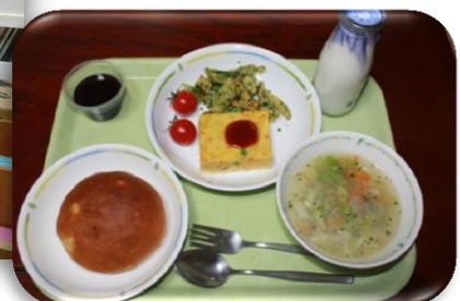
給食写真『王さまレストラン』より スペイン風オムレツ